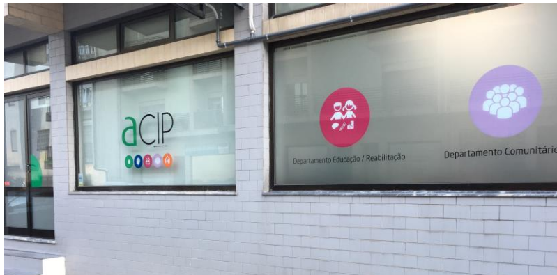
Departamento Comunitário de Lousada

O Departamento Comunitário está vocacionado para a promoção de ações e projetos de âmbito social dirigidos a grupos em situação de desvantagem socioeconómica, de forma a facilitar a integração e a participação social dos indivíduos e famílias.