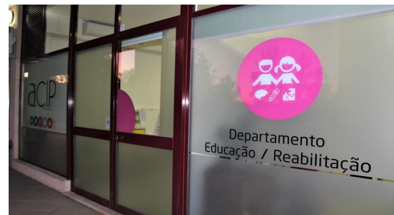
Departamento Educação/Reabilitação de Joane