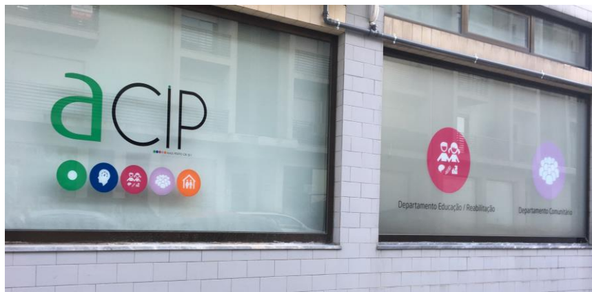
Departamento Educação/Reabilitação de Lousada

O Departamento de Educação/Reabilitação está vocacionado para a prestação de serviços terapêuticos a crianças e jovens, privilegiando o trabalho em rede nos contextos da família, escola e da comunidade em geral, no sentido de melhorar/aumentar o seu nível funcional e de qualidade de vida. Estamos certificados e registados na ERS – Entidade Reguladora da Saúde, como prestadores de cuidados de saúde.