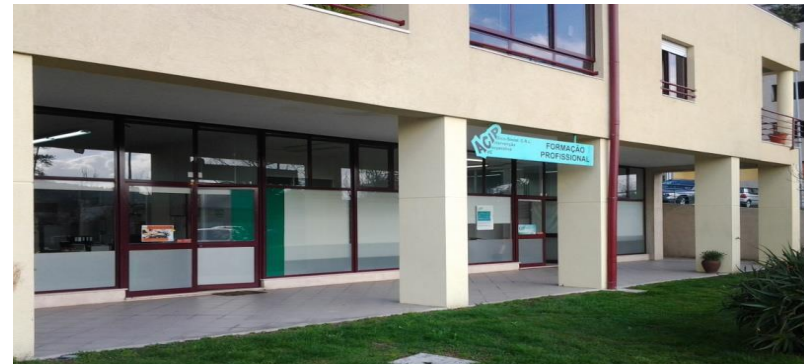
Departamento Comunitário de Joane